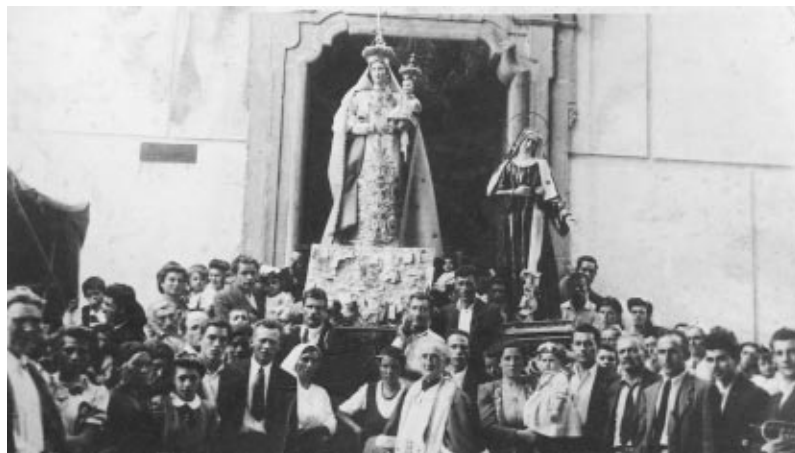
Una foto degli anni '50 ritrae la processione della Puceglia all'ingresso della Chiesa

La quantità consistente di risorse finanziarie che il Comune di Oliveto Citra ha saputo fin qui aggiudicarsi, testimonia la serietà con la quale l'Amministrazione ha saputo affrontare il problema del recupero urbano, e la competenza con la quale hanno lavorato tanto i dipendenti comunali, quanto i tecnici esterni.